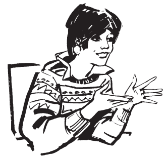
Mme B. en pleine action...

☼ Vous profitez habilement de votre casquette de professeur de mathématiques pour rappeler préventivement aux collègues et parents présents que, dix disciplines différentes devant s'exprimer, il serait bon que chacun limite son temps de parole à dix minutes (10 × 10 = 100 et 100 minutes = 1h 40)