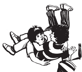
Bagarre dans la file d'attente ...

Et maintenant, totalisez le nombre de ✿, de ■, de ★ dans vos réponses et consultez vite les résultats du test page suivante !