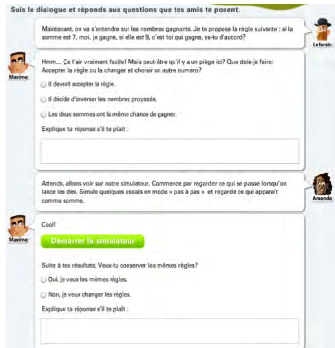
Figure 3 – Exemple du dialogue avec l'élève

En proposant à l'élève un choix de réponses, on l'invite explicitement à faire des prédictions, qui, selon les recherches, seront souvent basées sur l'intuition (dans ce cas, par exemple, que chaque somme donnée par les dés serait équiprobable, ou que le 9 va être plus fréquent, car 9 est plus grand que 7, ou bien l'élève peut se fier tout simplement sur 'son nombre préféré', comme la date de naissance). Chaque choix de l'élève doit être accompagné d'une explication permettant de conserver les traces numériques de son raisonnement. Dès que les choix sont faits, l'élève sera invité à faire une expérimentation à l'aide du simulateur. Ainsi, il pourra observer les résultats et les confronter à ses prédictions. Il porte ainsi un jugement sur les règles du jeu.