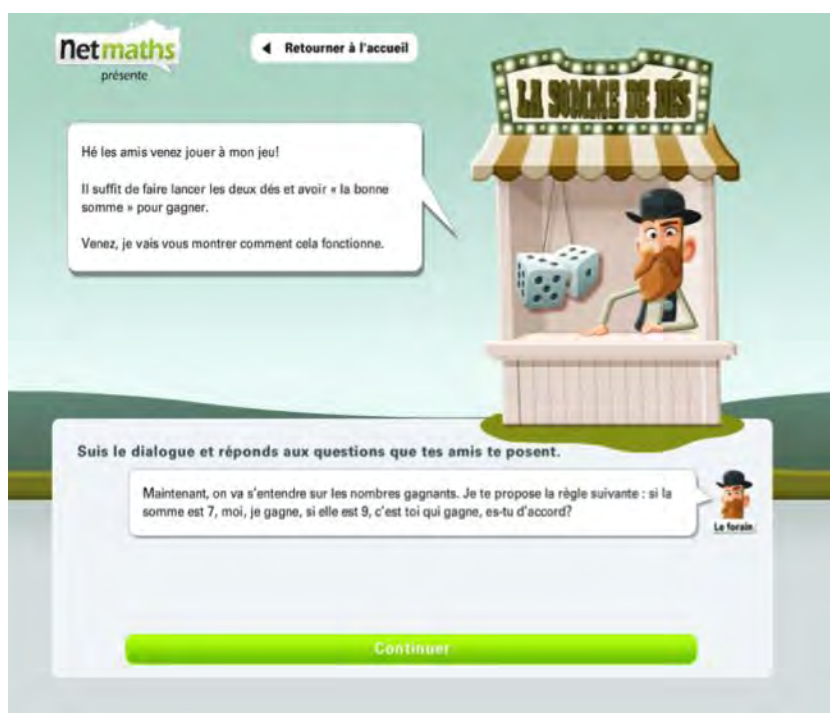
Figure 2 – Exemple d'introduction d'une mise au jeu dans l'option Fête foraine

Dans la version informatisée ( Fête foraine – Fig. 2), l'exploration est guidée par un personnage (bonimenteur) qui mène un dialogue avec l'élève.