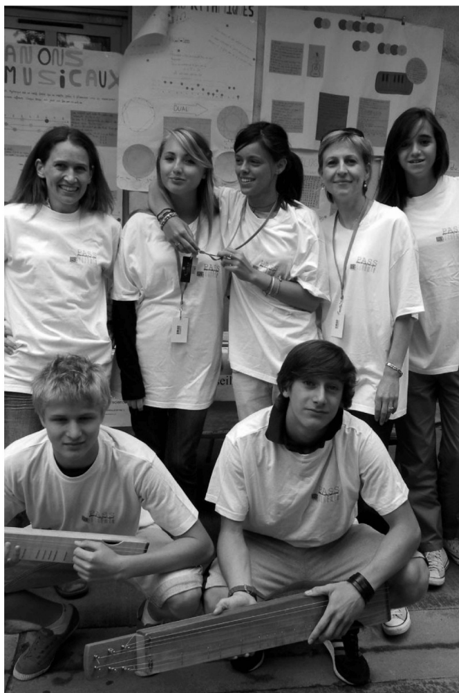
Figure 4 Les épinettes

Nous avons mis en pratique l'ensemble des notions abordées lors de la construction de deux épinettes. L'épinette des Vosges est un instrument diatonique à 6 cordes possédant des frettes comme la guitare. Les pièces ont été découpées par Joël LAPLANE dans son atelier et nous avons poncé, verni avec la solution préparée en chimie, calculé les emplacements des frettes, percé et assemblé les différentes pièces. Le cordage et l'accordage ont été effectués par le luthier en classe et les finitions réalisées à l'atelier (fig. 4).